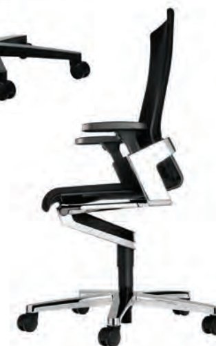
Кресло для руководителей On представлено на стр. 360